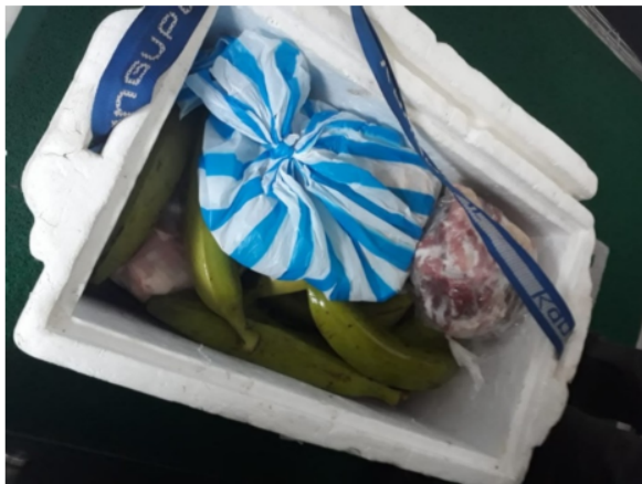
Fotografía 3. Medio de transporte de productos incautados, con rótulo interno SA-MA-22-0045. Productos de Hydrochoerus hydrochaeris . Acta Única de Control al Tráfico Ilegal de Flora y Fauna silvestre No. 161318.

Los productos fueron movilizados dentro de una nevera de icopor y dentro de bolsas plásticas, junto con otro tipo de alimentos para consumo humano (Fotografía 3).